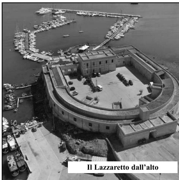
Il Lazzaretto dall'alto

Appena centomila euro annui sono gli incassi da "fitti attivi". E per il restante "patrimonio im-