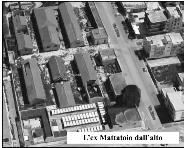
L'ex Mattatoio dall'alto

Dalla sua installazione lì dov'è, infatti, – sostengono quelli di "Città a