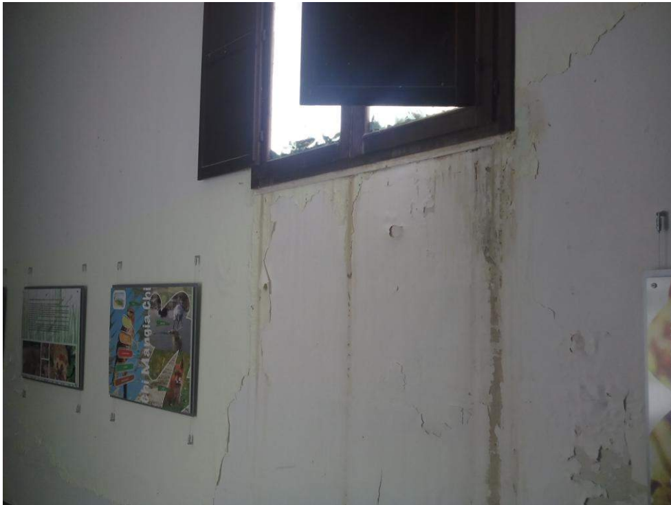
L'umidità la fa da padrone. Tintura parete scrostata, infiltrazioni dagli infissi.